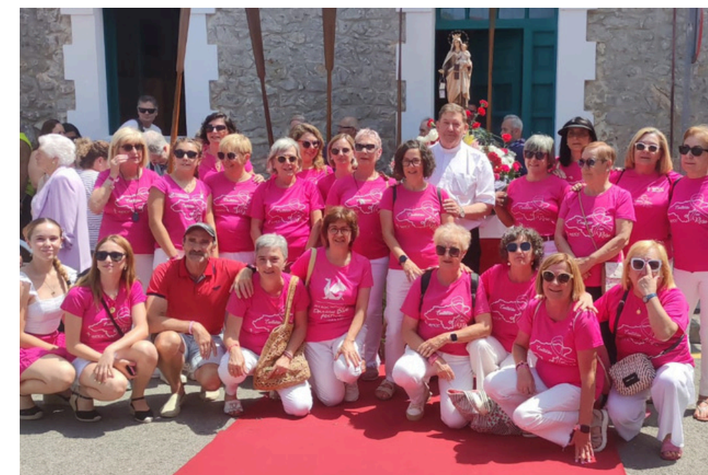
XXIII DÍA DE LA SIDRA ESCALANTE