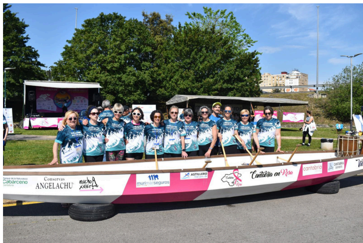
II MEMORIAL LOLA ECHEVARRÍA RÍA DE ASTILLERO 2024