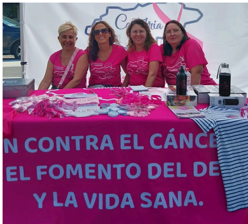
MERCADILLO IX ENCUENTRO CANINO - FELINO