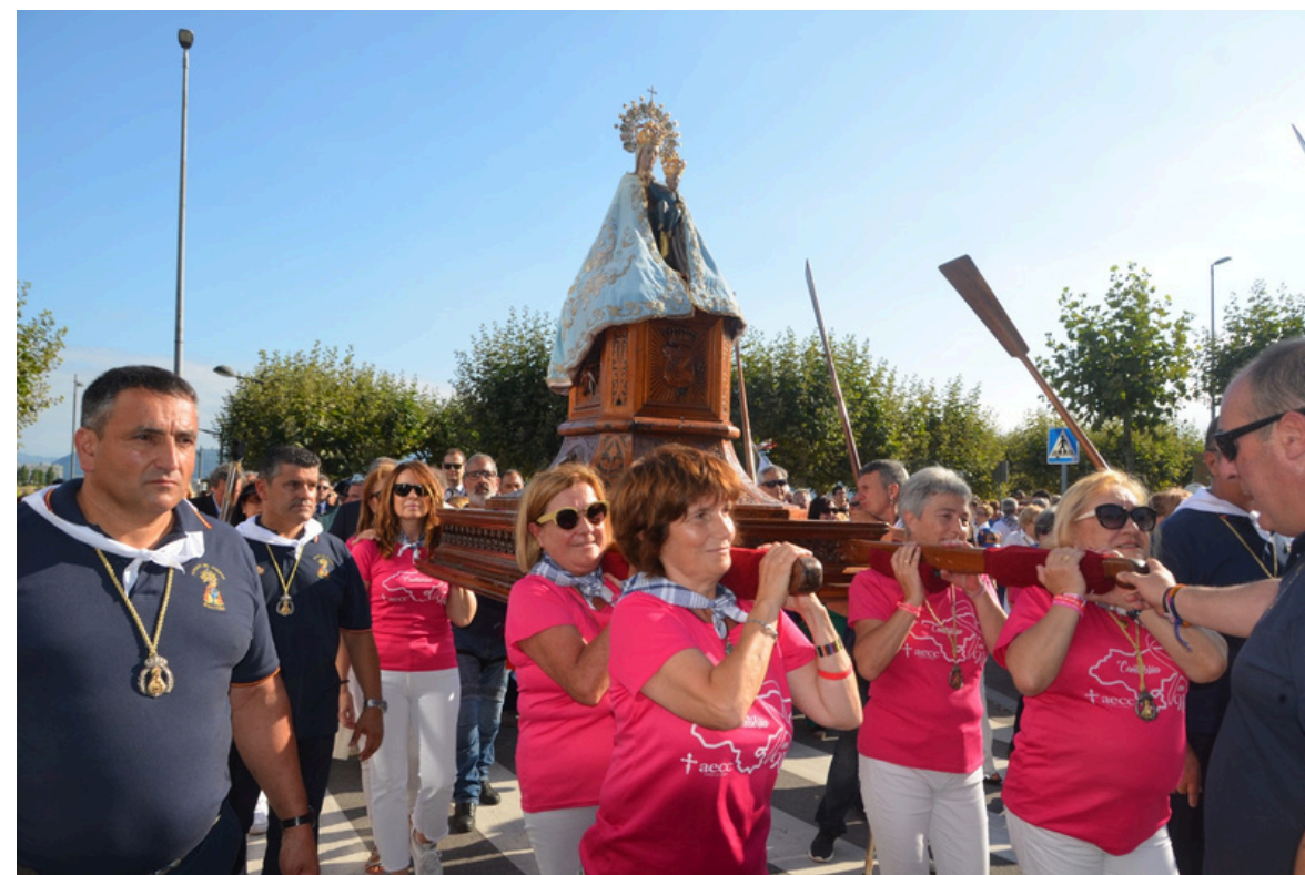
75 ANIVERSARIO VIRGEN DEL PUERTO