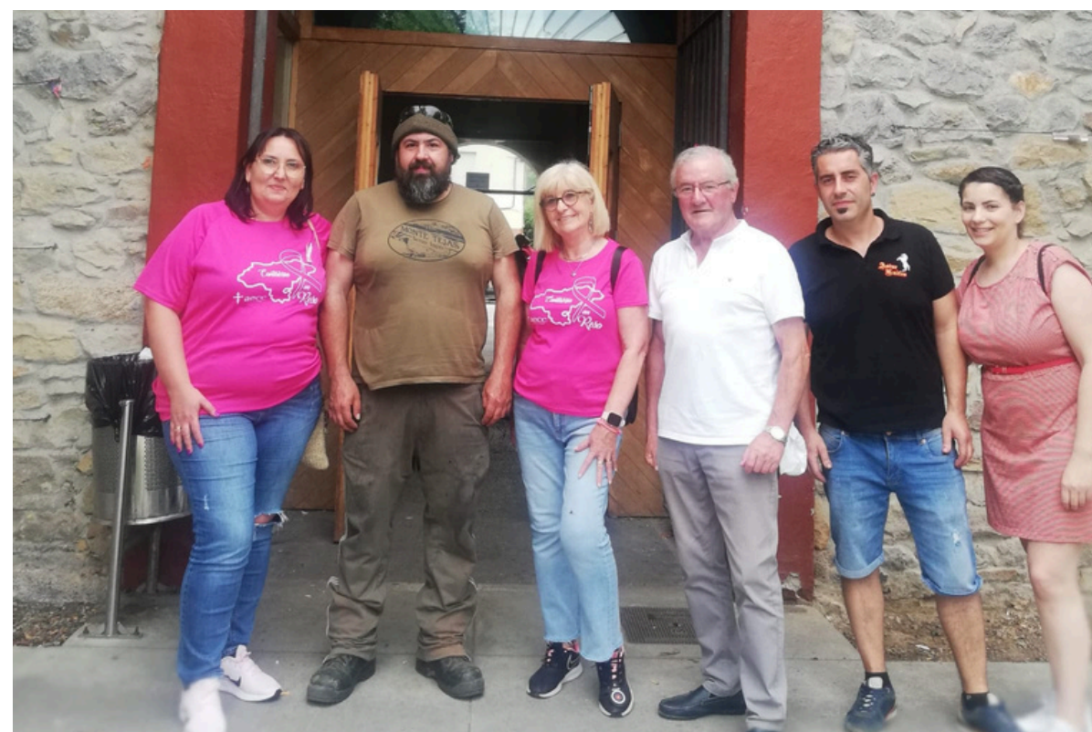
III ENCUENTRO CAZA CONTRA EL CANCER DE MAMA