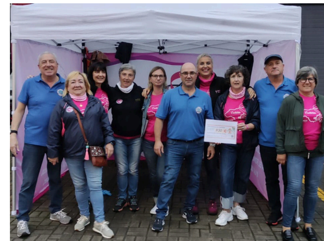
SARDINADA SOLIDARIA SANTOÑA