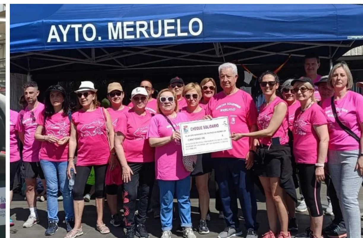
I MARCHA SOLIDARIA AYTO. MERUELO 2024