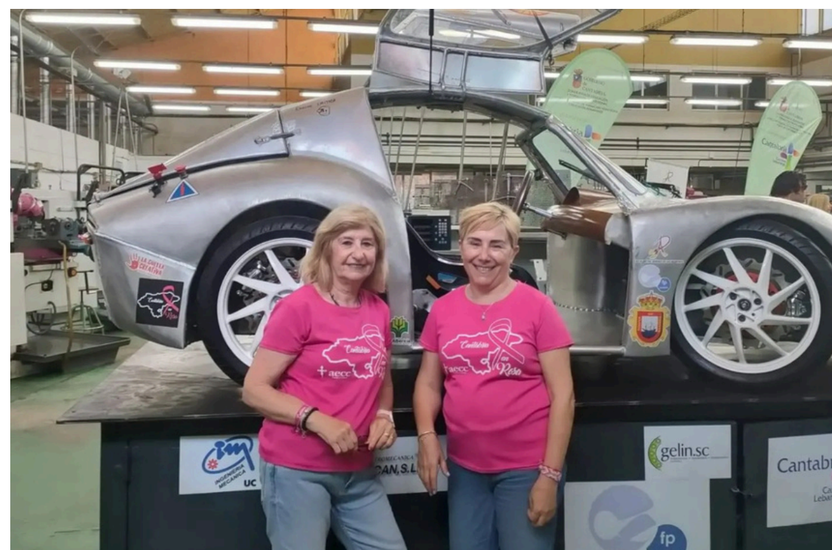
PRESENTACIÓN COCHES ELÉCTRICOS ECO GUARNIZO 2024